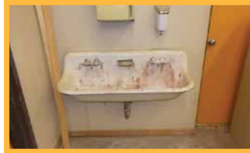
Tuberías y accesorios en los baños deben ser reemplazados