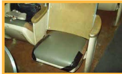
Instalaciones de 60 años necesitan reparaciones básicas de seguridad