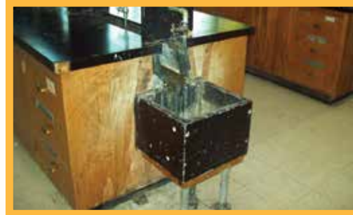
Laboratorios de ciencias son anticuados